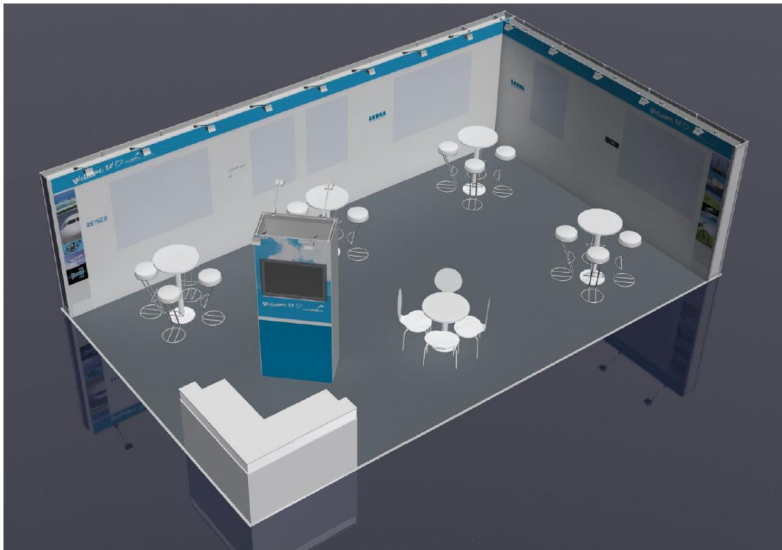
Beispielansicht von vorn oben aus dem Messeauftritt 2017